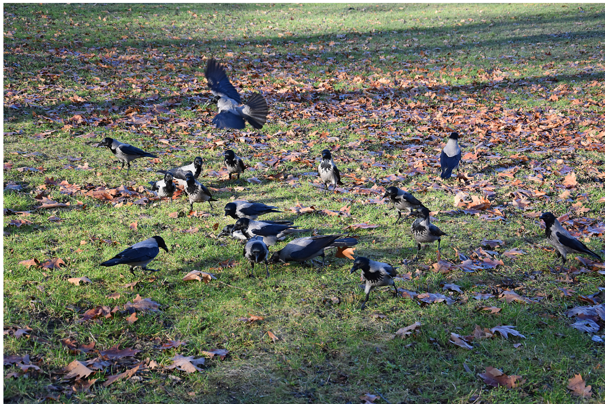
Wrony siwe w parku

kawek, wróbelków i wron siwych). Wziąłem do torby sporo pszenicy, a do kieszeni fistaszki w osłonkach i bez. Siedziały gromadami na drzewach lub dachach. Zlatywały się do mnie natchmiast. Rozsypywałem ziarna w różne miejsca, żeby nie robiły sobie krzywdy, rozpychając się w jednym miejscu. Były bardzo głodne. Żeby przeżyć, muszą jeść. W centrach miast ktoś im musi jedzeniem (najlepiej ziarnami) sypnąć. Asfaltem, płytkami i betonem się nie najedzą. Siedzący na ławkach ludzie i karmiący ptaki fast foodami (sami się też nimi opychają) wyrządzają im krzywdę. Nie brakuje wciąż, zwłaszcza zimą, podrzucających ptakom chleb. Przeciwników karmienia gołębi w mieście, jest niemało. Czasami wchodzimy sobie w paradę. Wściekli rzucają mięsem na te moje, zabronione przez nich, czyny. Lubię przyrodę, a ptaki szczególnie. Pomagam im od kilkudziesięciu lat.